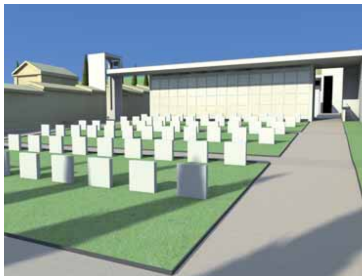
dettaglio cimitero di Monterotondo