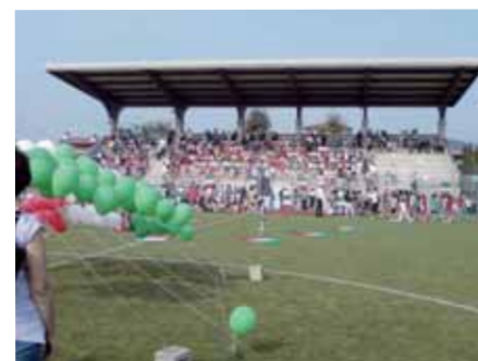
Cerimonia di inaugurazione dell'anno scolastico 2011/12 presso il campo di calcio in erba di Passirano.

La cerimonia, che ha visto riunirsi più di 600 ragazzi, sotto l'auspicio dell'unità nazionale, si è conclusa al canto dei ragazzi dell'inno d'Italia a cui è seguito il lancio verso il cielo dei palloncini verdi, bianchi e rossi.