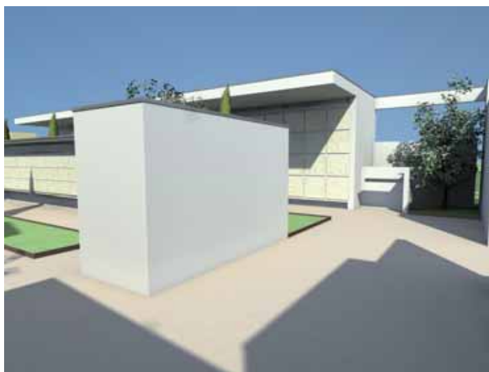
dettaglio cimitero di Camignone

Superficie totale di ampliamento: 1590 mq Superficie campi di inumazione: 235 mq Loculi di testa: 120 sepolture Nicchie cinerarie: 51 sepolture Edicole Gentilizie: 2 cappelle per un totale di 16 sepolture in loculi di fascia;