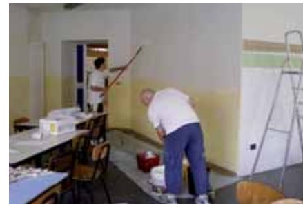
Progetto di manutenzione ed abbellimento dei locali scolastici: genitori ed insegnanti durante la tinteggiatura del refettorio della Primaria di Passirano.

stico in tutti i plessi. Si rifletta sul fatto che, al ritmo di un paio di aule all'anno per plesso, nell'arco di un quinquennio potremmo rinnovare e mantenere tutti i nostri spazi scolastici, consentendo ai nostri ragazzi di vivere in ambienti decorosi.