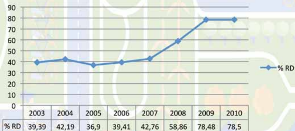
% Raccolta Differenziata - Comune di Passirano