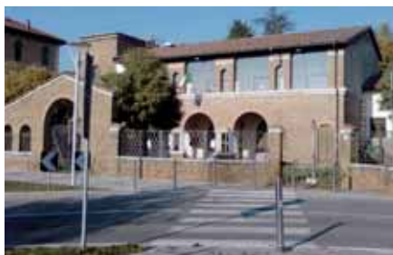
Teatro civico. Dal 1° settembre 2011 al piano terra trova sede la segreteria scolastica dell'Istituto Comprensivo di Passirano-Paderno.

Lo spostamento degli uffici di segreteria ha consentito di dare soluzione ad una delle situazioni più critiche dei plessi comunali; invertendo la tendenza in atto da alcuni anni, che vedeva la progressiva abolizione dei laboratori e la loro conversione in aule.